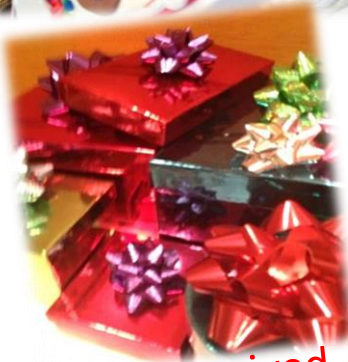
Everyone received presents from him!